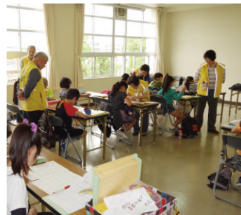
昨年まで門真っ子に通っていた子どもたち、門真っ子の保護者も丸つけボランティアとして参加。

門真っ子の一番の持ち味は、角の取れた退職教職員による手厚い支援です。一つの教室に5人も6人もいますので、解らないときに手を挙げると、直ぐに、そしてじっくりと見てもくれます。 初めは仕方なしにやって来ていた子ども、回を重ねるうちに自分から進んで通ってくるようになります。分かる喜びを実感し、学ぶ意欲を育むことを大切にしながら活動しています。