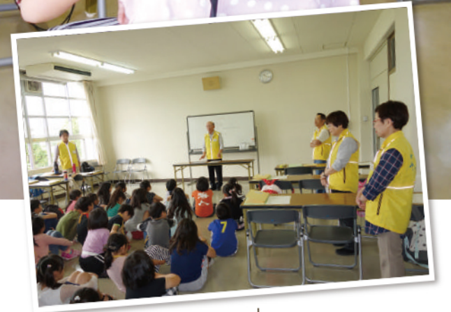
(写真右) 5月の開校式の様子。少し緊張した面持ちの子ども達。持ち物やルールをみんなで確認。