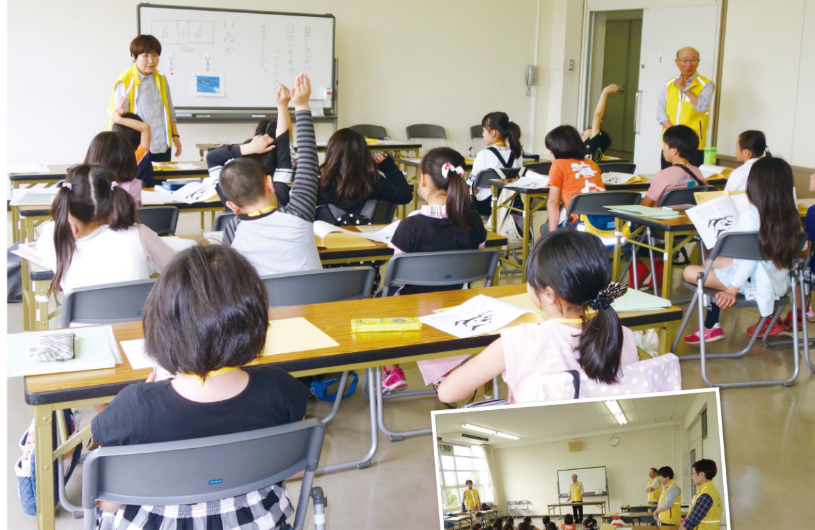
(写真上) 国語の授業の様子。オリジナルのテキストを使って学習していきます。