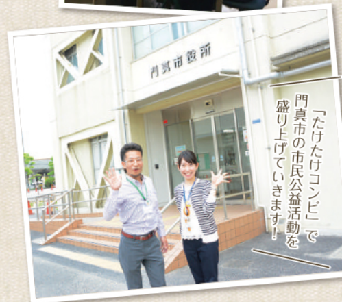
「たけたけコンビ」で門真市の市民公益活動を盛り上げていきます!