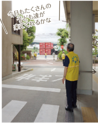
黄色いベストをつけた先生たちが、「門真っ子」に通う子ども達の安全を見守ってくれます。

学校が休みの土曜日の午前中、門真市内の小学校3・4年生の希望者を募り、市民プラザと文化会館を会場に国語と算数の学習会を行っています。 国語は読むことの楽しさに気付いてもらって読解力を伸ばせるように、また算数では学校で習ったことを復習してしっかり定着できるように取り組んでいます。今年は合計128名の子どもたちが参加しています。 これ以外にも保護者からの教育相談を受けたり、学校現場からの要請で3年生の社会科の時間に門真の歴史の跡を巡る際のガイド役も引き受けています。